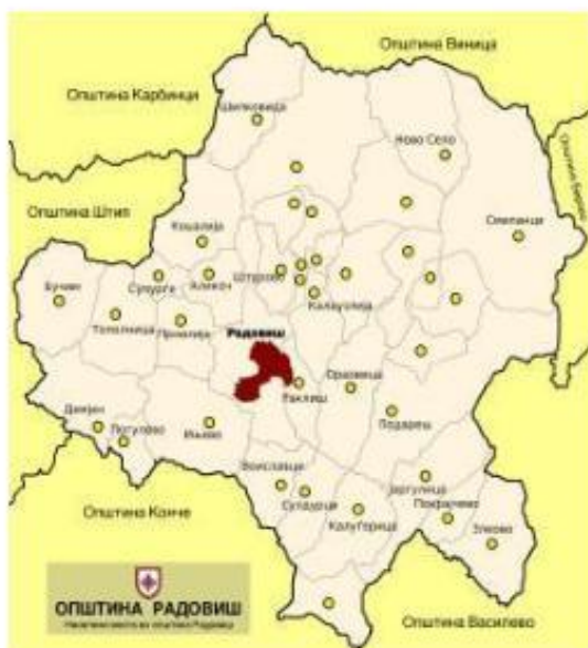
Слика 1: Општина Радовиш

Територијата на Југоисточниот регион се простира помеѓу планинскиот масив на север и североисток со Плачковица, на југоисток со Струмичко Поле, југозапад со пл. Смрдеш и северозапад со клисурата на Маденска река.