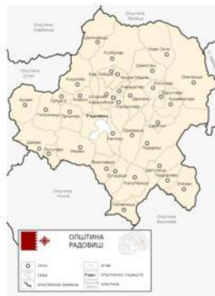
Слика 2: Населени места во Општината

Југоисточниот регион е еден од осумте статистички и плански региони на Р.С.Македонија. Овој регион се наоѓа во југоисточниот дел на државата и се граничи со Бугарија на исток и Грција на југ и внатрешно